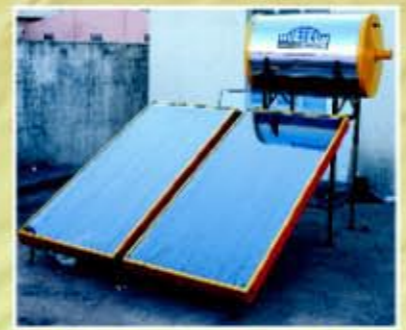
200 ಎಲ್‌ಒಡಿ ಗೃಹ ಬಳಕೆ ವಾಟರ್ ಹೀಟರ್