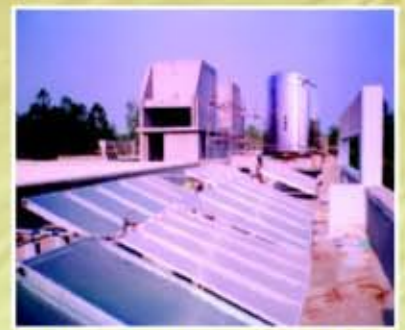
5000 ಎಲ್‌ಒಡಿ ಸೋಲಾರ್ ವಾಟರ್ ಹೀಟರ್